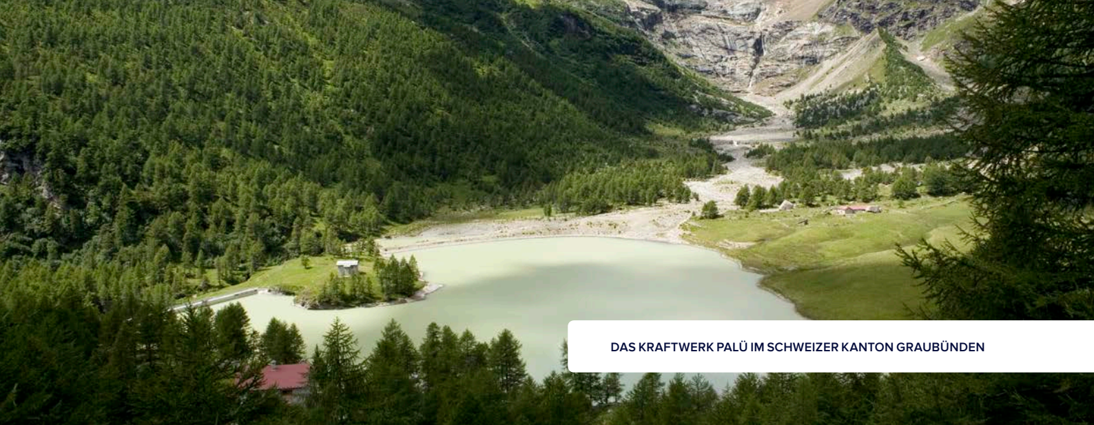
DAS KRAFTWERK PALÜ IM SCHWEIZER KANTON GRAUBÜNDEN